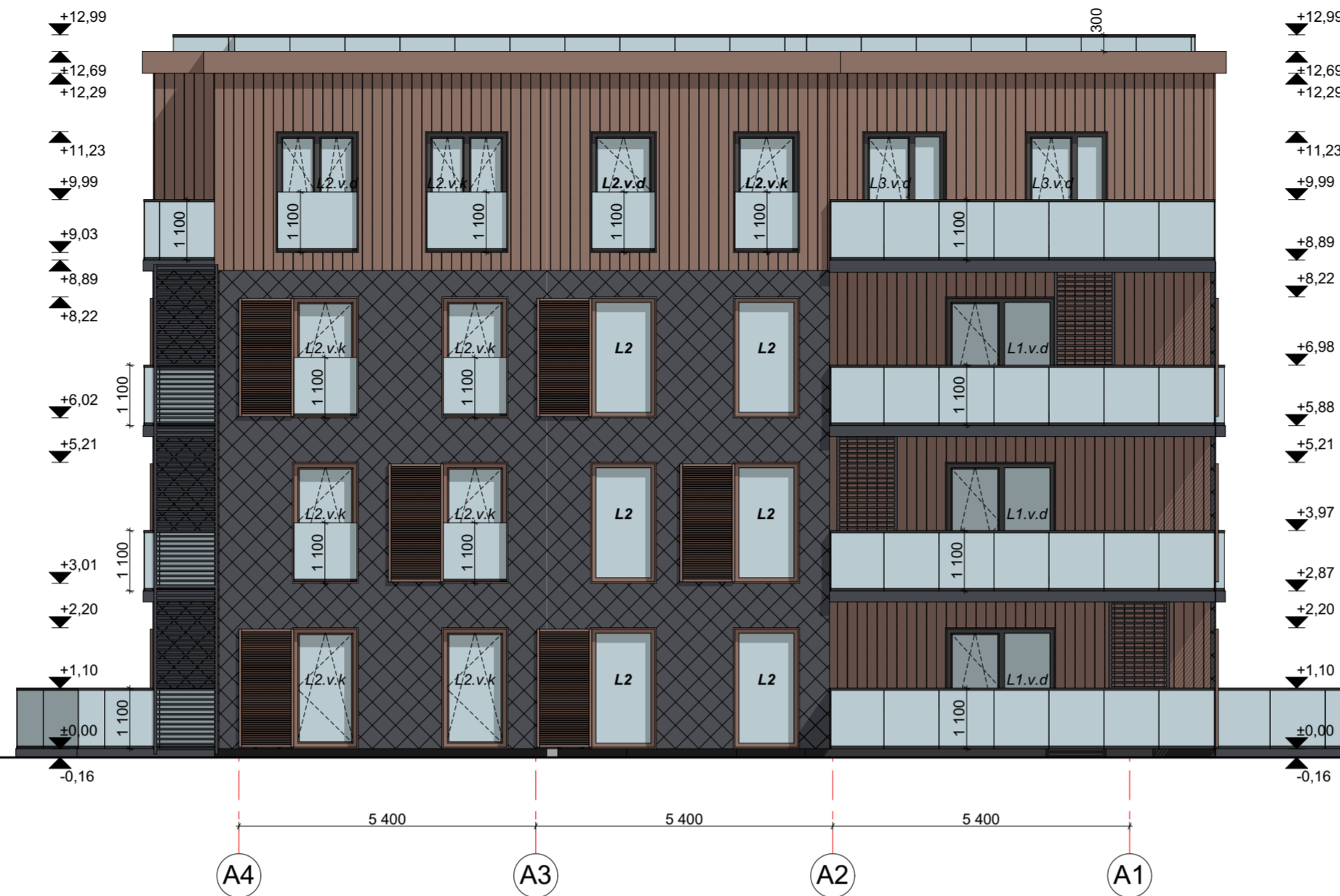
FASADAS A4-A1 M 1:100