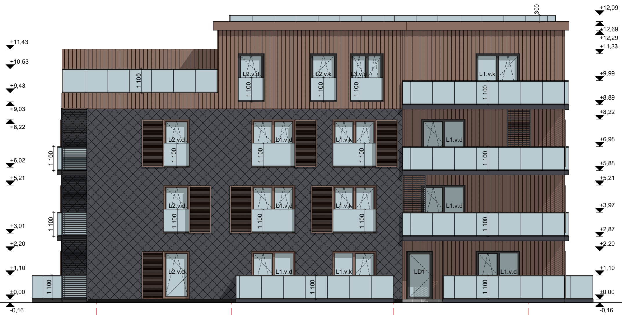
FASADAS AA-AD M 1:100