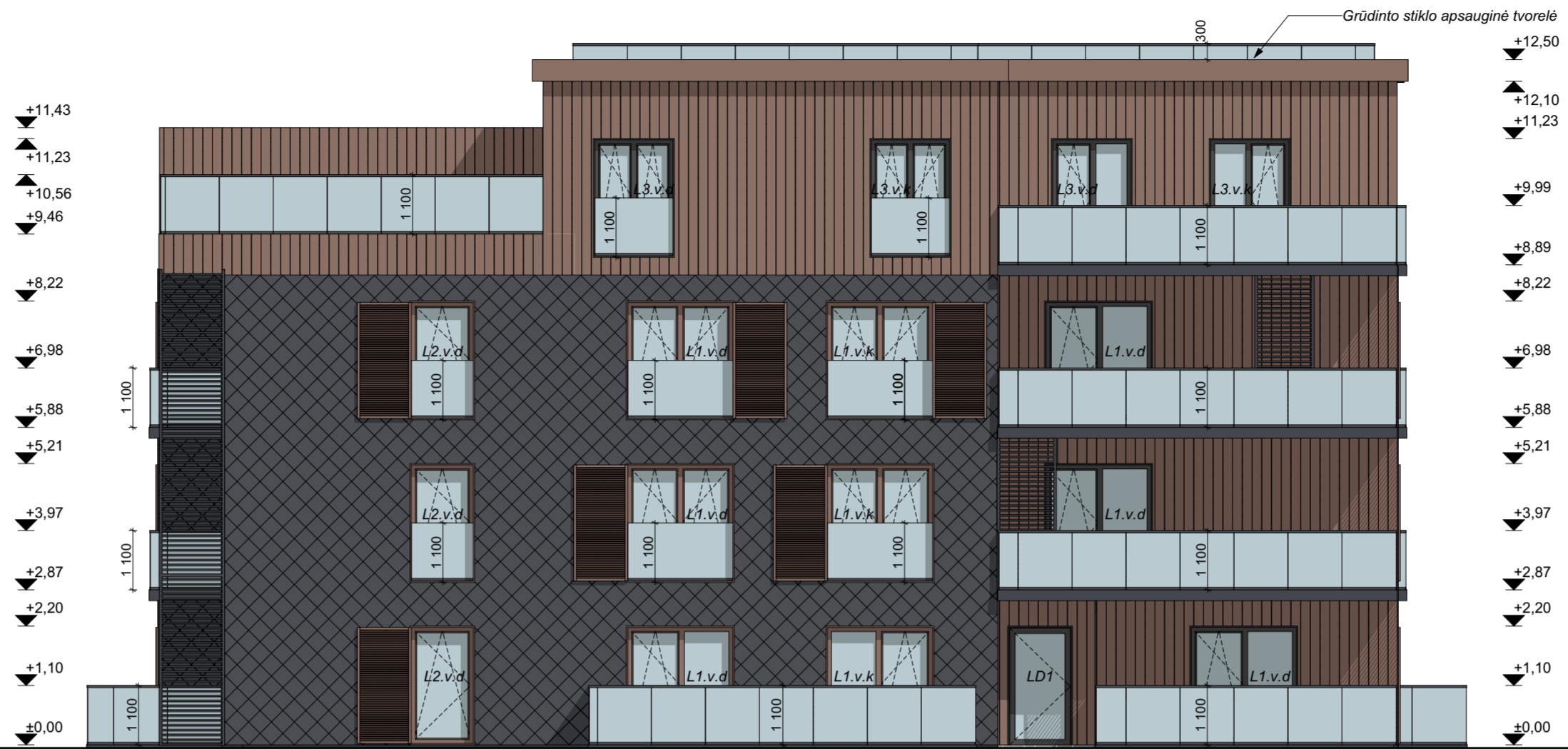
FASADAS B4-B1 M 1:100