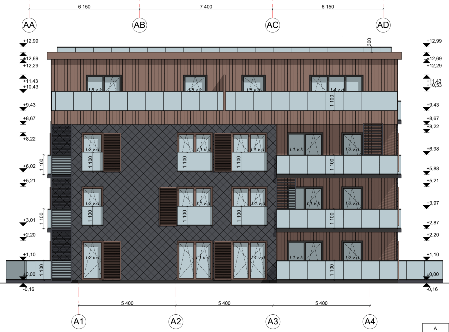
FASADAS A1-A4 M 1:100