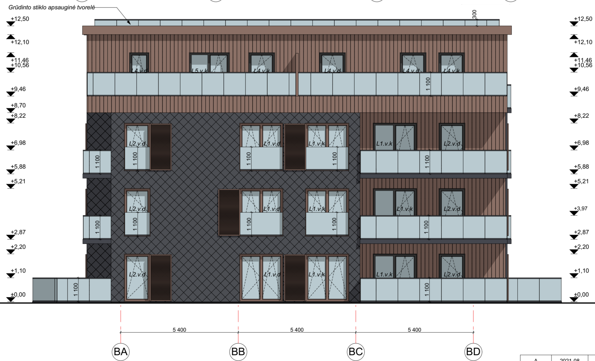
FASADAS BA-BD M 1:100