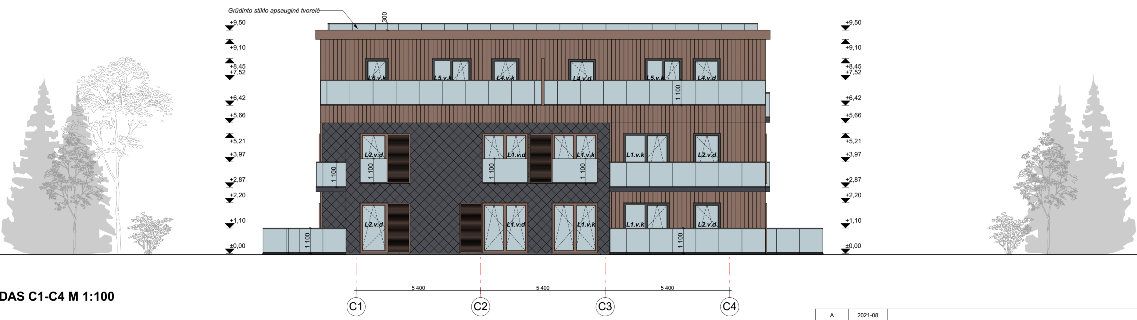
FASADAS C1-C4 M 1:100