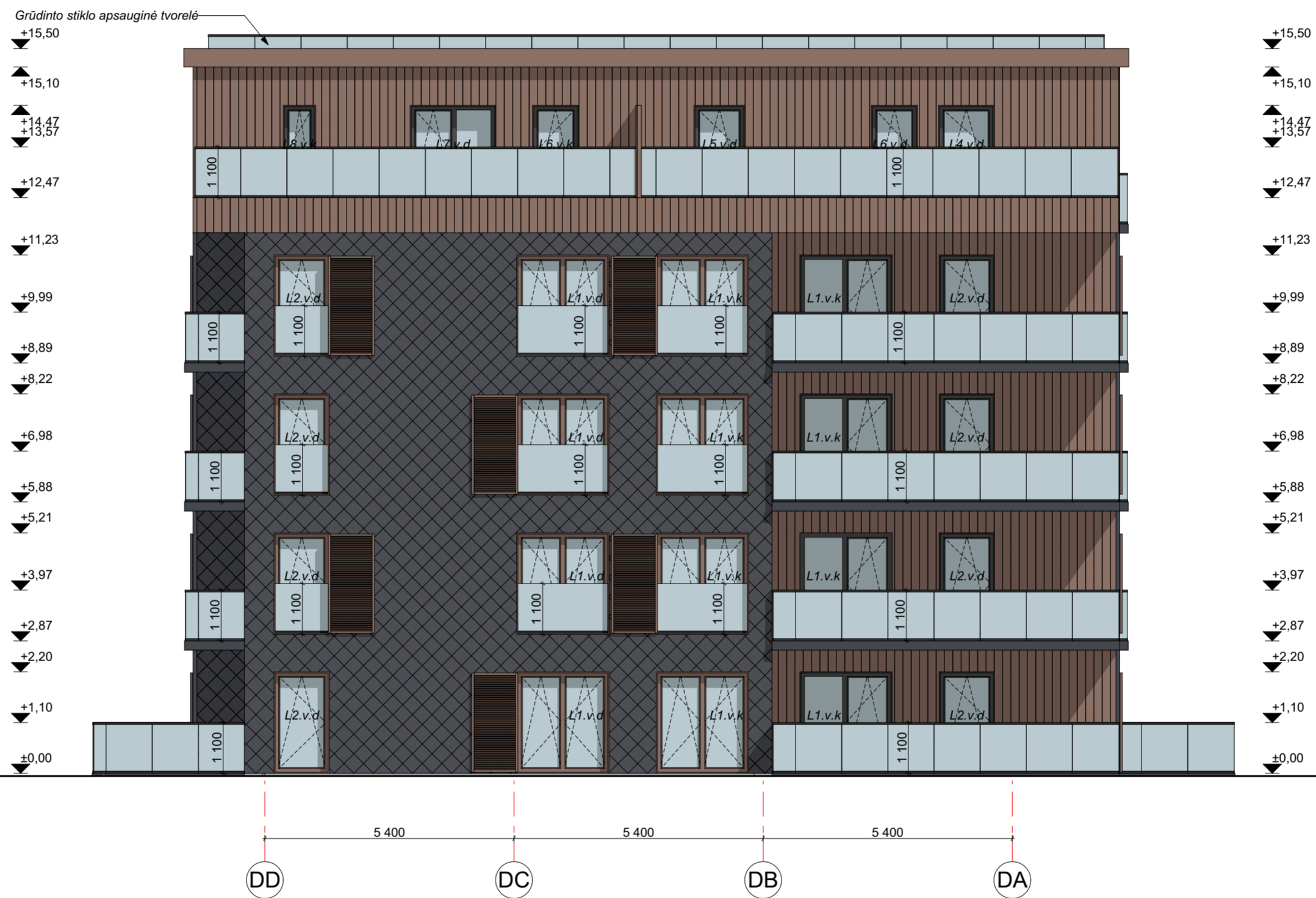
FASADAS DD-DA M 1:100