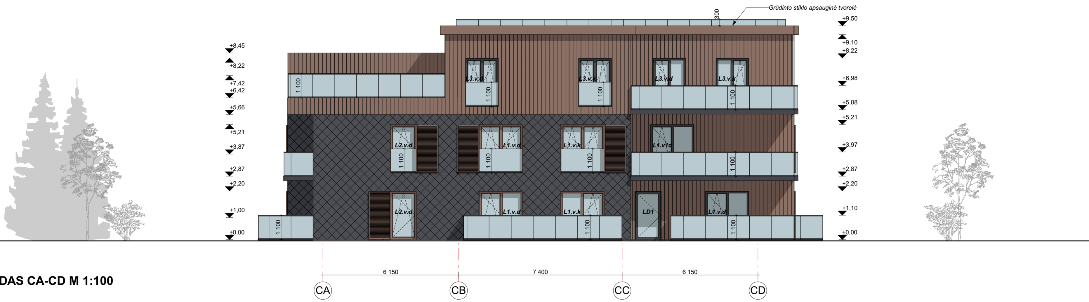
FASADAS CA-CD M 1:100