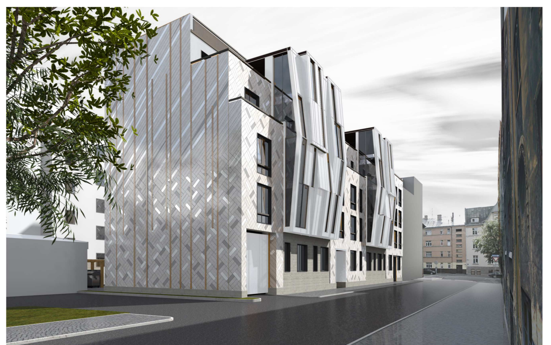
PROJEKTĒTĀ DAUDZDZĪVOKĻU NAMA VIZUALIZĀCIJA